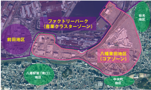
検討対象エリア：八幡東田地区（コアゾーン） および前田地区・ファクトリーパークゾーン

これからのまちづくりに取り組んでいくにあたり、これまでの足跡を振り返ると共に、多様な志民の皆さんとの対話を通じてその声や想いを積み重ね、「アクションベースド・ビジョン」として策定しました。今を生きる私たちが、一人ひとりの想いや志の実現に向けて、この地で一步踏み出すための灯となるようなビジョンに育てていきたいと思ひます。