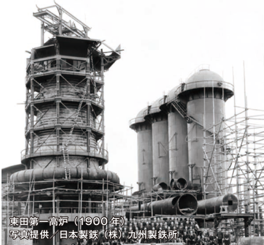
東田第一高炉（1900年）

福岡県北九州市の中心に位置する八幡東田地区は、1901年の官営八幡製鐵所操業開始以来、我が国の産業革命発祥の地として20世紀の扉を開いた歴史ある街であり、1990年代より官民連携で新たなまちづくりに着手、先進的な都市基盤の整備や職・住・学・遊の高度な都市機能の導入を進め、次世代を担う産業・ビジネスが集積し、年間来街者2千万人超を迎える都市拠点に進化してきました。