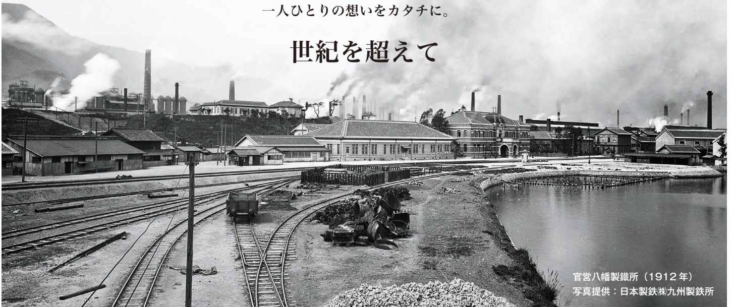
官営八幡製鐵所（1912年）